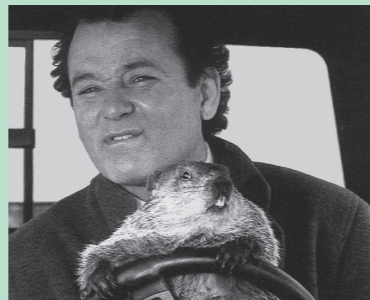
CAT.> Fotograma del film 'El día de la marmota' protagonitzat per Bill Murray CAST.> Fotograma del film 'El día de la marmota' protagonizado por Bill Murray ENG.> Screenshot from 'Groundhog Day' starring Bill Murray