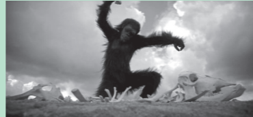
CAT.> Fotograma del film '2001 Odisea a l'espai' d'Stanley Kubrick CAST.> Fotograma del film '2001 Odisea en el espacio' de Stanley Kubrick ENG.> Screenshot from '2001: A Space Odyssey' directed by Stanley Kubrick

El resultat de la instal·lació no deixa de ser una llibertat tancada que planteja petits punts de fuga nascuts del joc profanador de la transgressió, aplicada a la norma, a partir d'una espècie de cinisme cíníc amb el cinisme.