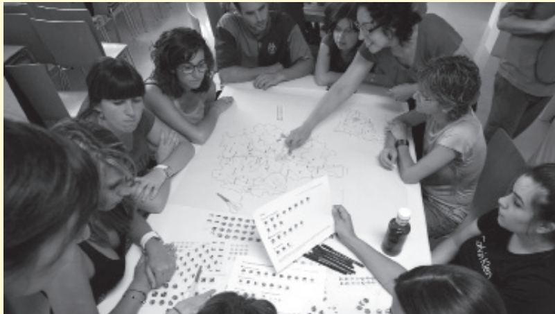
Mapeo Colectivo. Iconoclasistas. Taller realitzat en el marc de la QUAM 2011 - WIKPOLIS. Vic, 2011.

Guifi.net / Efraín Foglia, Iconoclasistas, Mona Fawaz / Ahmad Gharbieh / Mona Harb, Stalker / Primavera Romana, Torolab