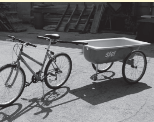
SPOT (Servei Públic d'Optimització de Trastos), projecte de Makea. Taller realitzat en el marc del projecte "Ceci n'est pas une voiture", ACVíc-Idensitat. Vic, 2011.