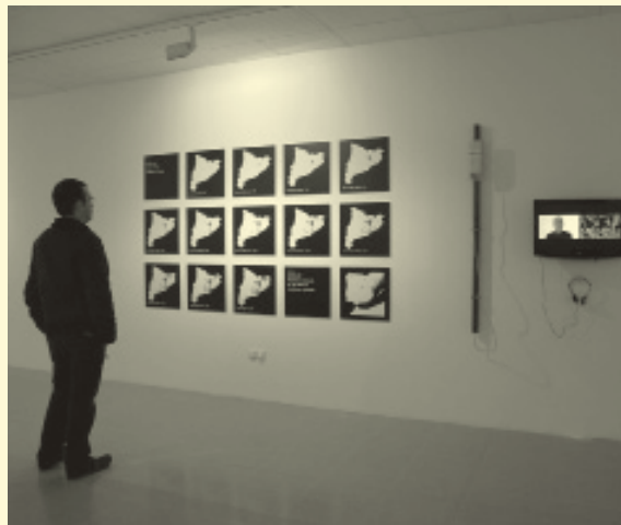
Guifi.net. Exposició Apamar. Gràfiques, mètriques i polítiques de l'espai. Vic, 2011.

◀ Homeland , projecte de Torolab. Oakland, 2009-2011.