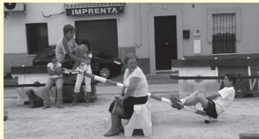
Ordenación y ocupación temporal de solares. Santiago Cirugeda - Recetas Urbanas. Sevilla, 2004.

entre els participants, però també amb agents externs que ho sol·liciten o que posteriorment en faran ús. Són propostes que responen de manera creativa a la regulació sofisticada dels espais públics, cercant vies que reivindiquen un ús més autogestionat i lliure de l'espai. Estrategias subversivas de ocupación urbana, Banco Guerrilla, Wikitankers , noms amb una clara connotació bèl·lica per a uns objectes que proposen ocupacions temporals de l'espai públic i que despleguen estratègies per tal que el ciutadà s'impliqui com a agent actiu en la transformació urbana. Un àmbit estimulat per la pràctica incipient de Santiago Cirugeda - Recetas Urbanas i que posteriorment troba un desenvolupament exponencial a partir de la xarxa Arquitecturas Colectivas .