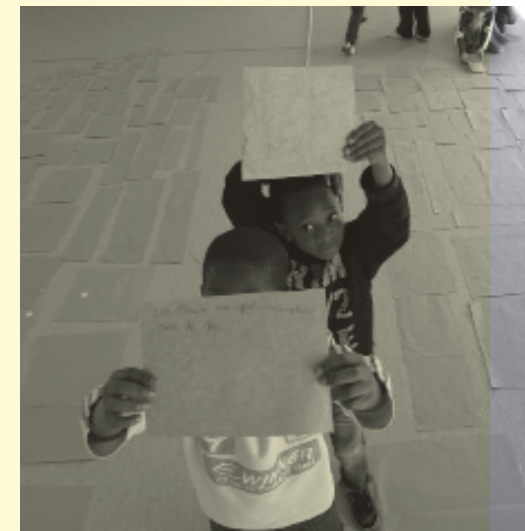
Al portal de casa_ i els constructors_ , projecte de Jordi Canudas. Vic, 2011. Fotografia Jordi Canudas.

ves que han estat articulades per les persones que habiten un indret específic. Una comunitat configurada per múltiples comunitats que tenen el barri com a element comú entre les narratives, les persones i l'espai. El barri és també el lloc des d'on l'escola ensenya a aprendre. Aquesta experiència es pot entendre des de l'àmbit artístic i educatiu, però sobretot des d'una voluntat transversal que els relaciona.