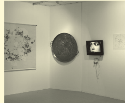
◀ Geografie dell'Oltrecittà i Agricolture nomadi, projectes de Stalker / Primavera Romana. Roma, 2009-2010.