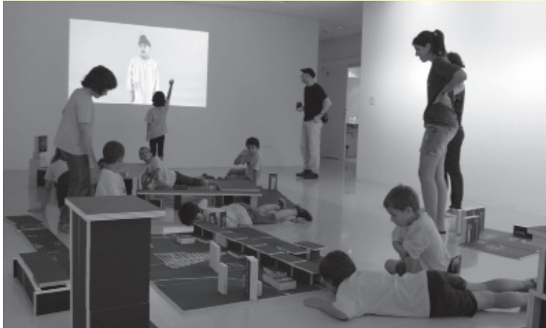
Al portal de casa_ i els constructors_ , projecte de Jordi Canudas. Vic, 2011.

Posar en relació l'art i l'educació és un dels pilars del treball d'ACVic.